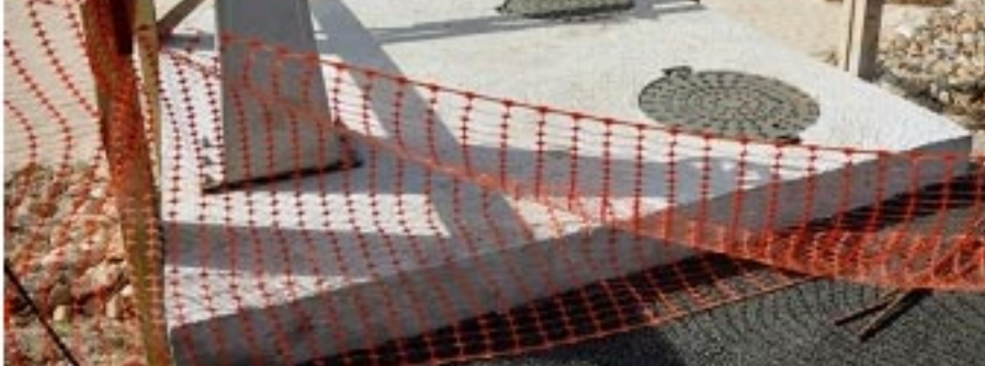
Vanne du bassin du giratoire des Trois Moulins