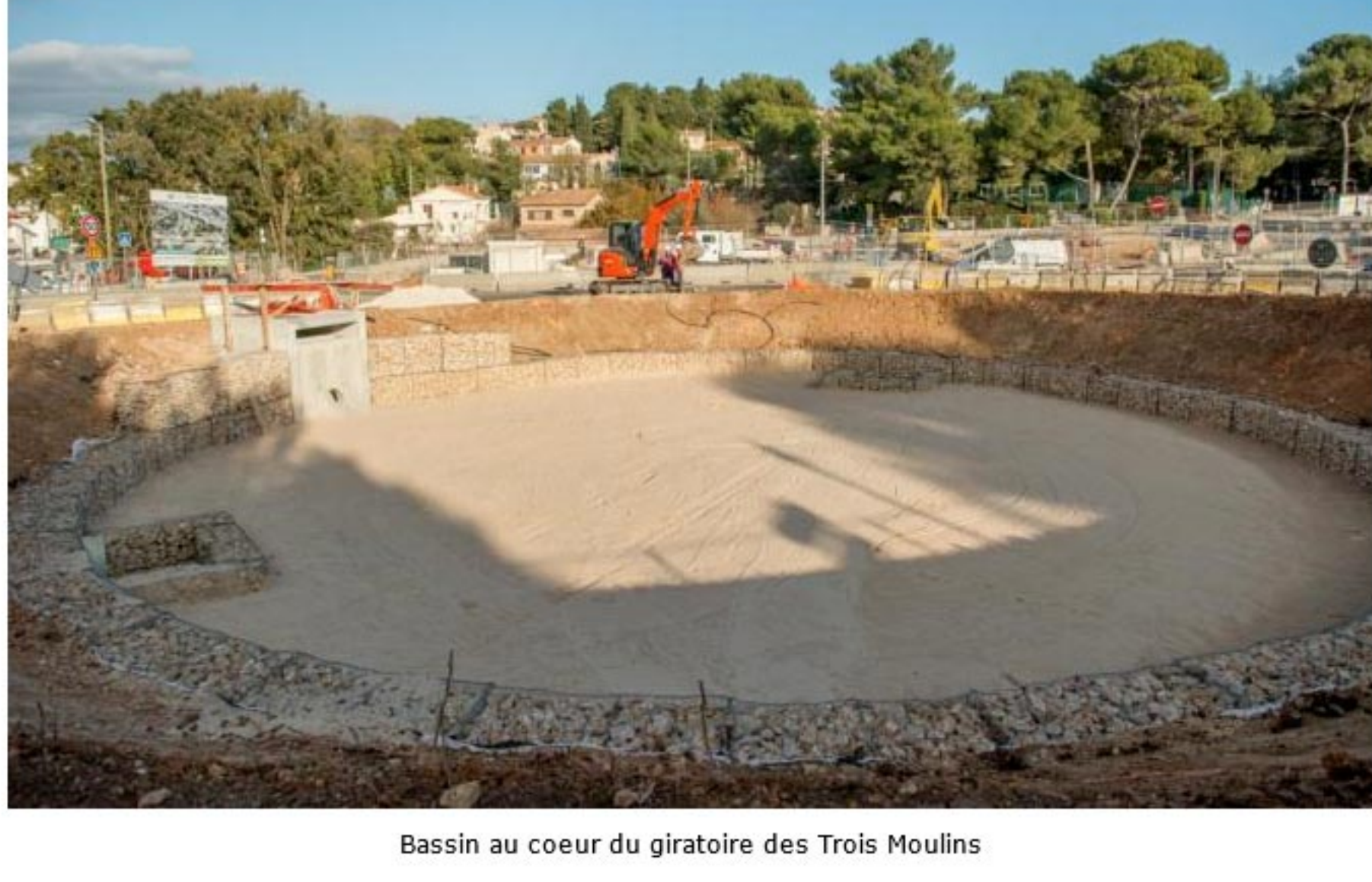
Bassin au cœur du giratoire des Trois Moulins

Ce sont des ouvrages de stockage des eaux pluviales. Les eaux stockées sont évacuées :