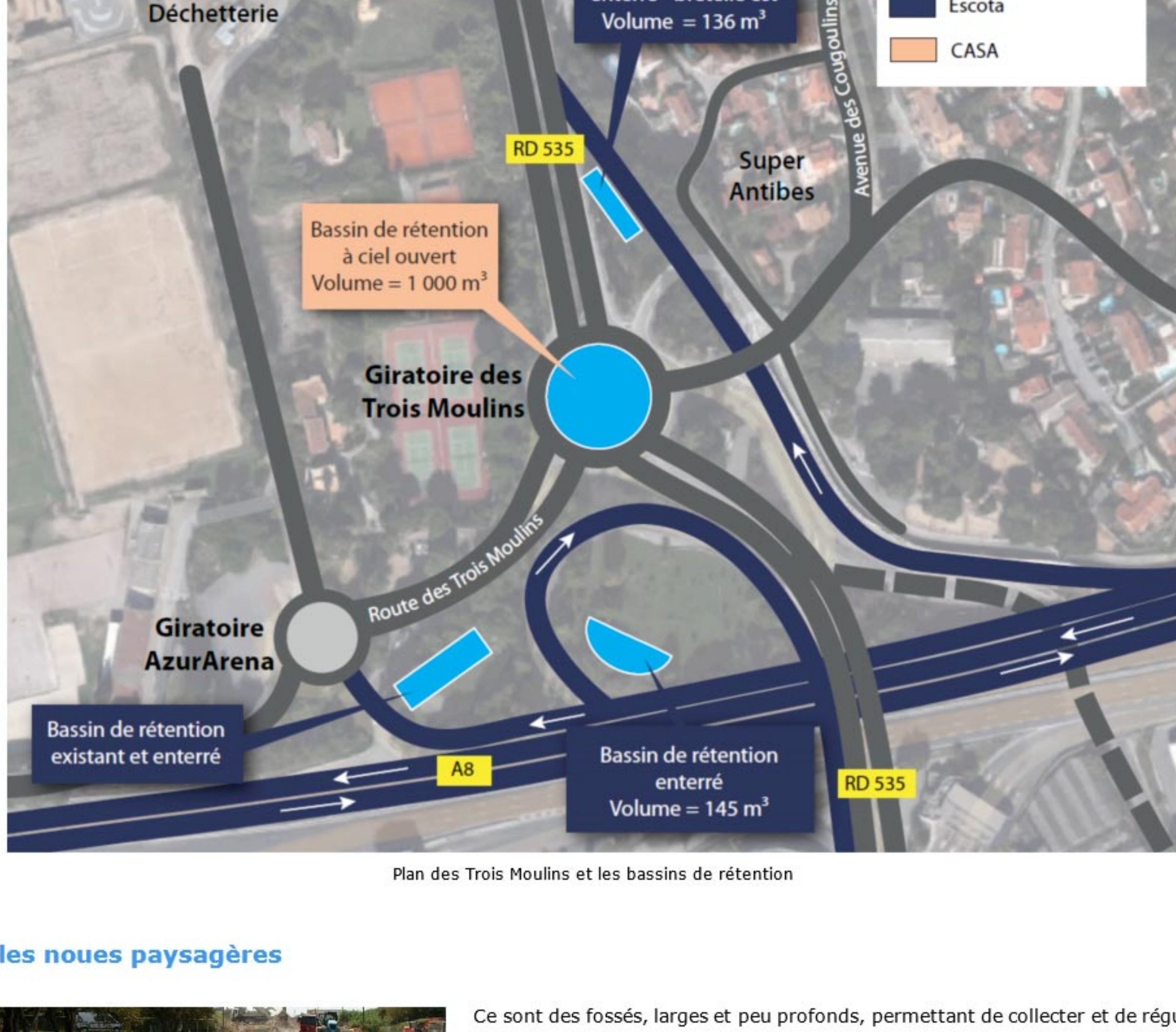
Plan des Trois Moulins et les bassins de rétention